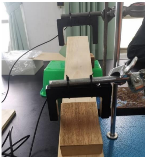
照片說明：安裝計時器並設定