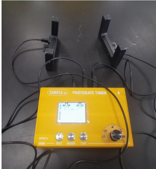
照片說明：計時器開箱