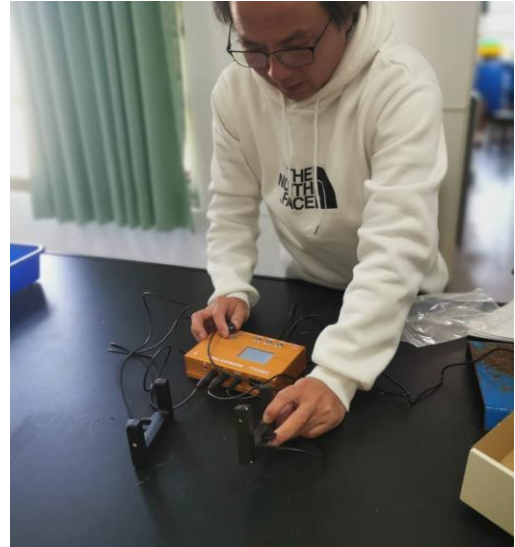
照片說明：老師檢查計時器功能